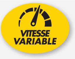
CM 226 GT